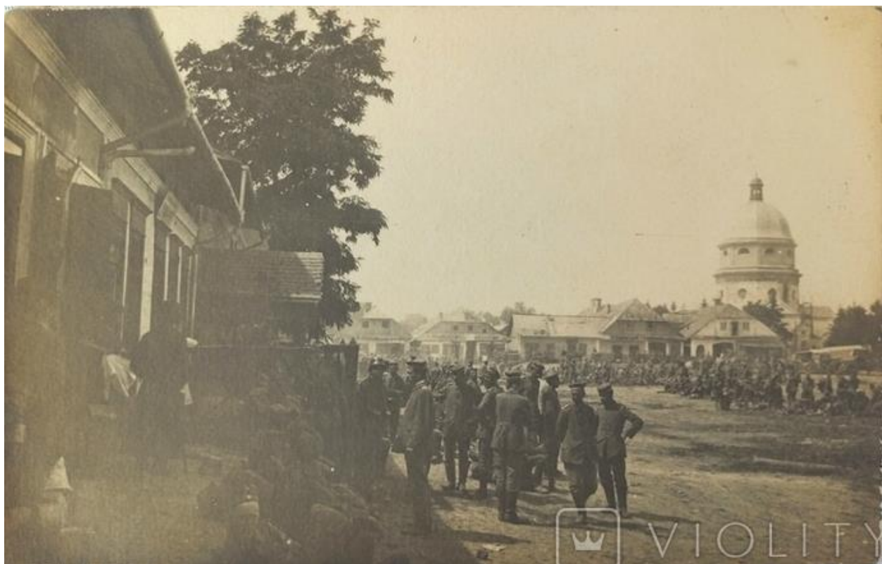
Войнилів, ринкова площа. 1917 р. 78

Після окупації Західноукраїнської Народної Республіки поляками в 1919 році в містечку був осередок постерунку поліції та гміни Войнилів Калуського повіту.