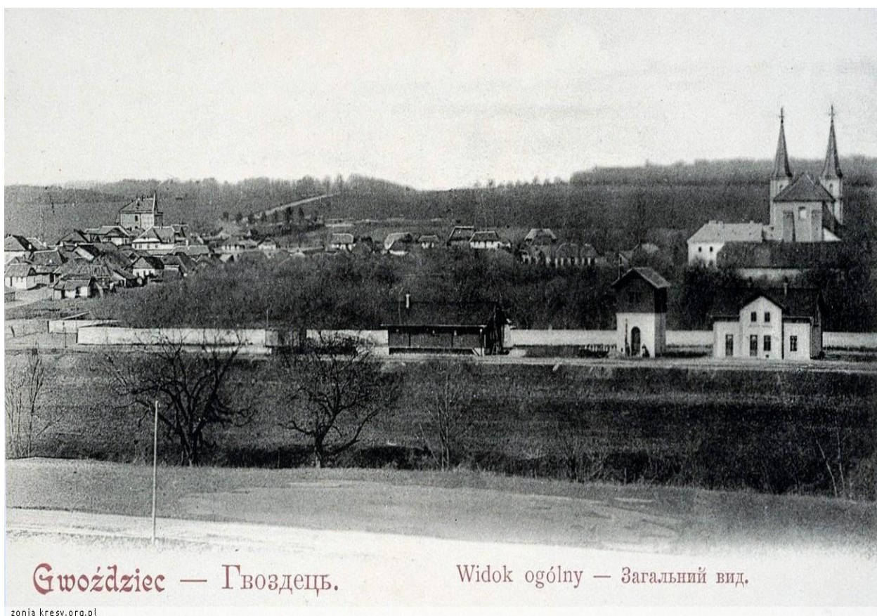
Гвіздець, 1920 рік. 99

Під час Другої світової війни, у 1939 році, згідно Пакту Молотова — Ріббентропа містечко перейшло до СРСР у складі УРСР.