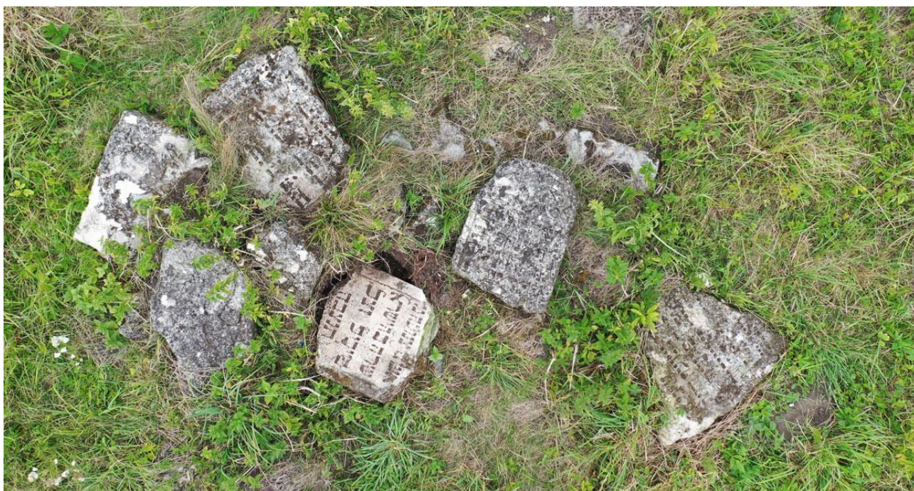
Войнилів, мацеви на єврейському цвинтарі. 83

Напередодні Другої світової війни, навесні 1939 року, Сидор Рей емігрував до Нью-Йорка. Його дружина і дочка, що залишилися в Польщі, загинули в Кракові під час Голокосту.