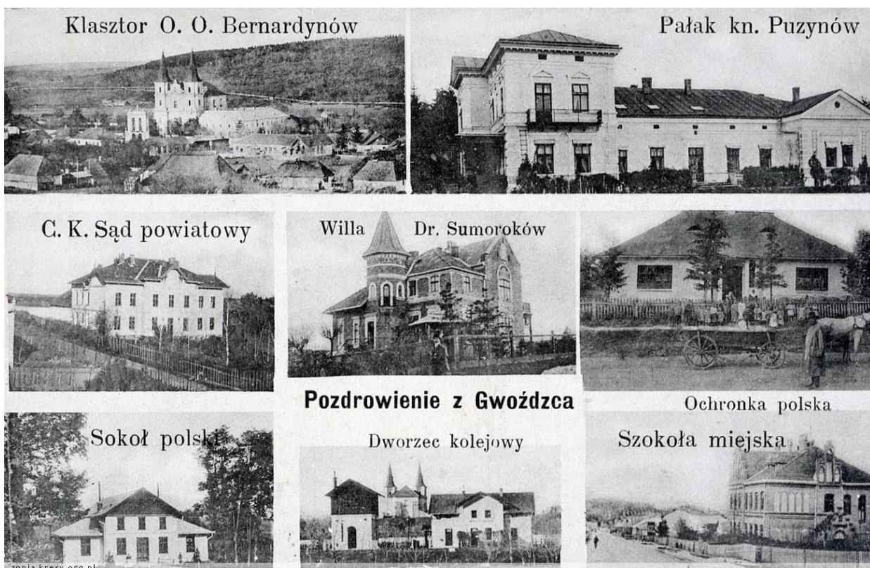
Гвіздець, 1920 р. 95

Перша згадка про Гвіздець 15 грудня 1373 року: князь Володислав Опольський в Ярославі 96 надає поселення Гвіздець руському шляхтичу Ходку (Хотку) Лоєвичу 97 за його заслуги, також поселення Чернова (Чернява). На умовах: може брати данину грошима, мешканці прикріплюються за землею, Лойович розпоряджається. Повинен виставляти військо в разі війни (1 піший, 1 кінний).