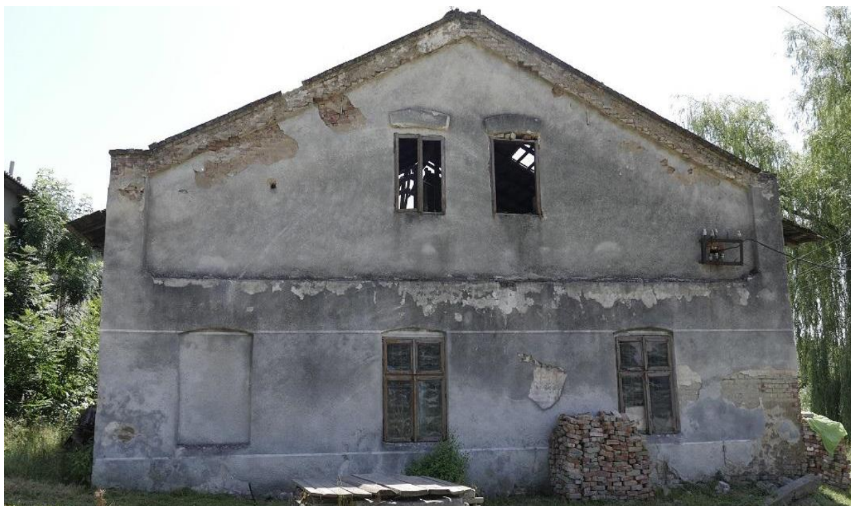
Букачівці, будівля синагоги. 2007 р. 53

Збереглася синагога, документи свідчать, що її збудовано близько 1727 року, перебудовано біля 1797 року. Після Другої світової війни її перебудували на цех пекарні. Біля неї розміщено міську лазню – колишня міква. 52