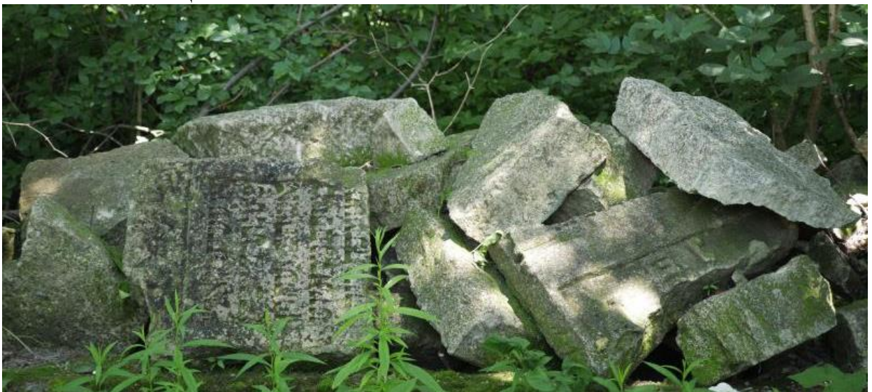
Букачівці, мацеві на єврейському цвинтарі. 2019 р. 55

На межі 20-21 століть з ініціативи єврейських громад була зроблена спроба огородити некрополь бетонними плитами. Його не добудували, а вже готові елементи стіни та воріт з часом зруйнувалися. В.2019 р. біля залишків огорожі можна знайти поодинокі надгробки, ймовірно перенесені з початкового місця.