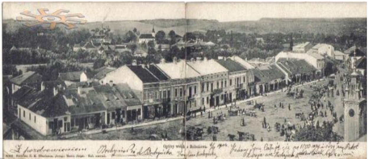
Панорама Болехова у 1904 р. 23

Місто стало відомим на Заході завдяки книзі американського письменника Даніеля Мендельсона «Загублені: Пошук шести із шести мільйонів» (англ. The Lost: A Search for Six of Six Million ), яка розповідає про долю єврейської громади міста.