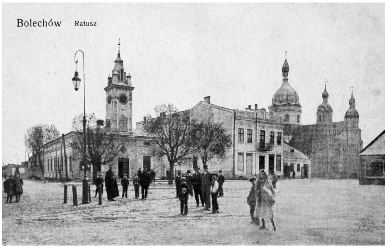
Ринкова площа в Болехові. Зліва ратуша, кам'яниця № 14 і собор Святих жінок-мироносиць. 1910-1920 роки. 19

Перша письмова згадка про «болехівські» землі належить до 1371 р. У податковому реєстрі 1515 року в Болехові з присілками Підгірче і Чишів документуються 3 попи (отже, уже тоді було 3 церкви), два млини і 30 ланів (близько 450 га) оброблюваної землі 20 . У документах XV ст. згадується як Болехів Волоський.