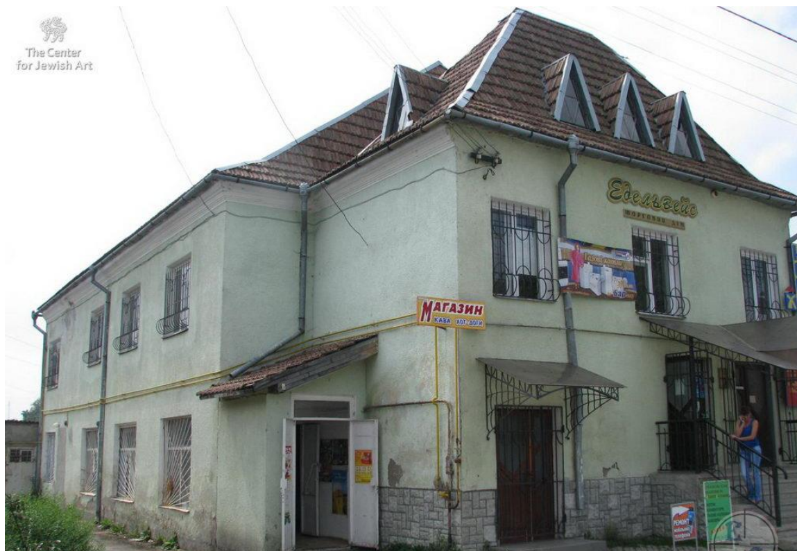
Синагога в Брошневі, 2009р. 44

У 1946 – 1953 рр. тут був пересильний пункт для висилання людей у Сибір (колишній табір для військовополонених з 10 бараків), встановлений пам'ятний знак 43 .