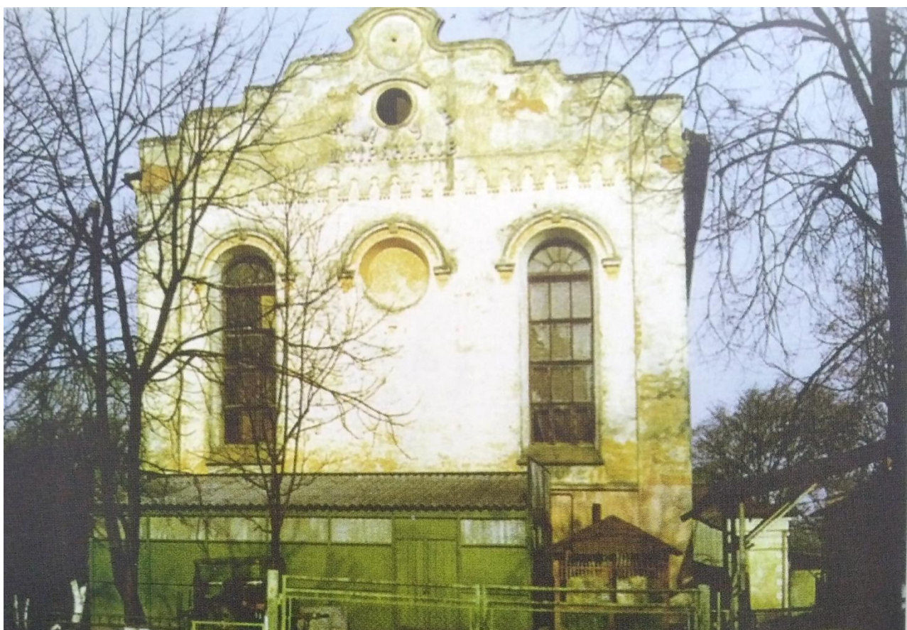
Болехів, будівля синагоги. 32