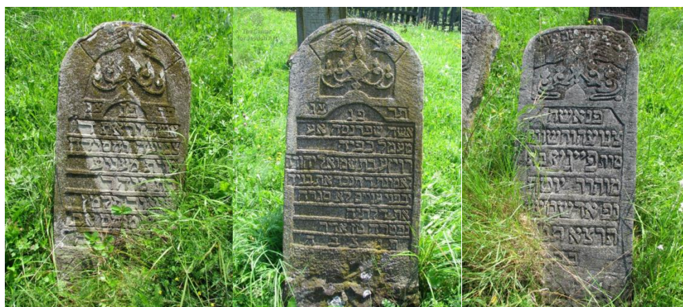
Верховина (Жаб'є), єврейський цвинтар. 72