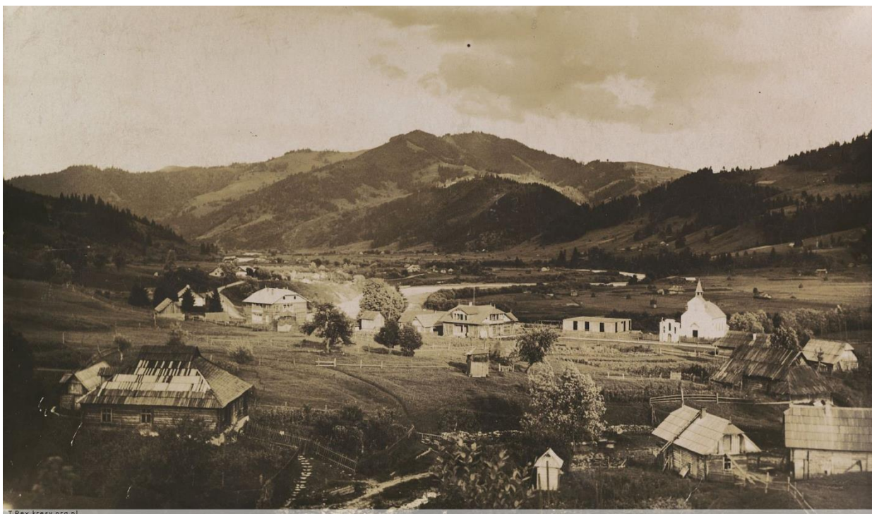
Жаб'є, частина міста з римо-католицьким костелом.1935 р. 66

Жаб'є (Zabie) – один із центрів гуцульської культури, районний центр. У 1962 р. «советами» воно було перейменоване у «Верховина».