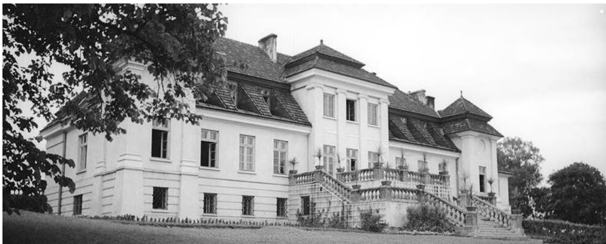
Палац Кшечуновича 1938 р. Зараз це будинок для людей похилого віку. 3

Ще однією чудовою оздобою та мистецькою досконалістю архітектурного обличчя давнього містечка відзначається колишня садиба-палац Кшечуновичів, що вирізняється вдалим розташуванням в середовищі серед зеленого масиву великого парку.