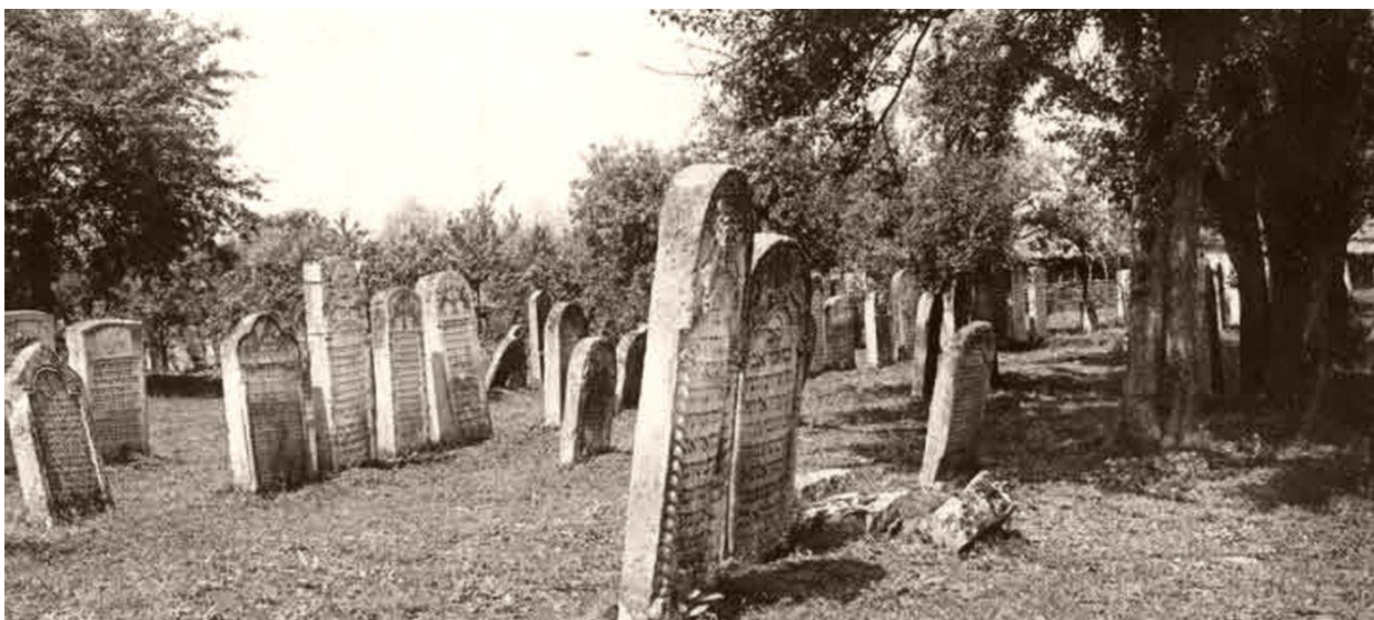
Галич, єврейський цвинтар. 1914-1918 рр. 93

У 1970-80-х роках. у Галичі проживало кілька єврейських та караїмських сімей. Сьогодні у Галичі ні євреїв, ні караїмів немає.