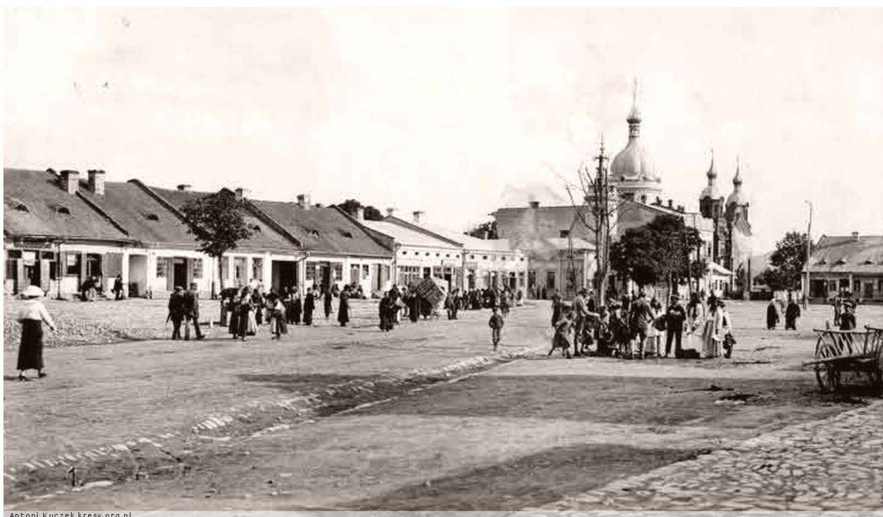
Болехів, ринок. 6 серпня 1917 р. 30