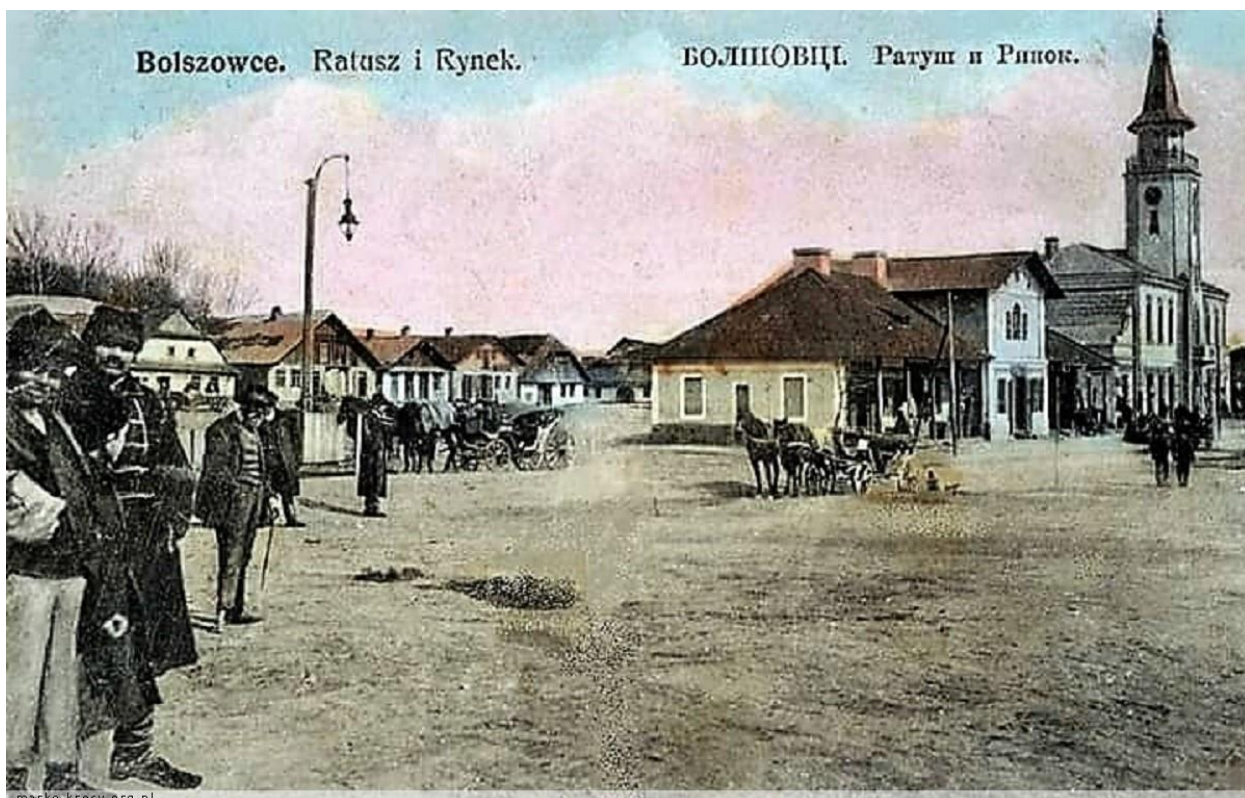
Більшивці, ратуша і ринок. 1910 рік. 2

Вперше ця місцевість згадується 8 березня 1402 року, коли вдова галицького старости Петра Сокирка віддала "на вічні часи своє село Бовшев Мінор" католицькому архієпископу Якову Стрепі.