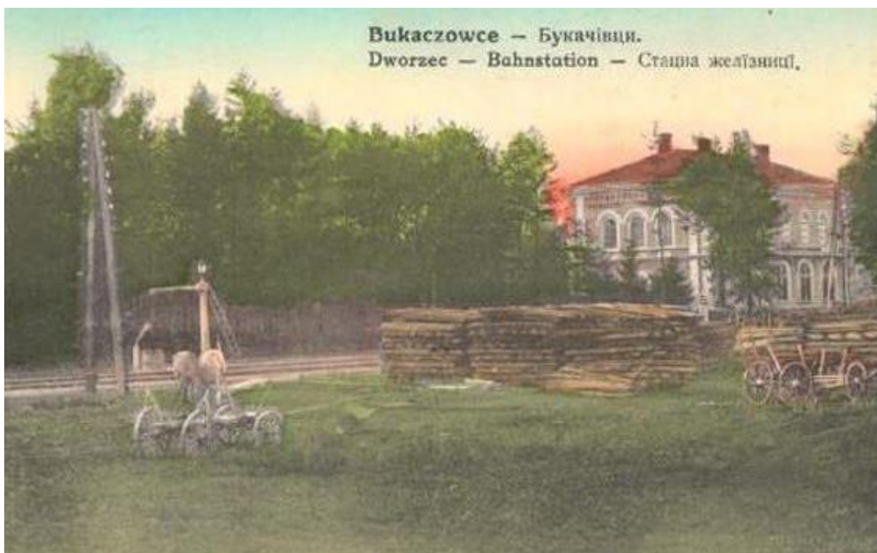
Букачівці перед Першою світовою війною. 46

Перша згадка в письмових джерелах про Букачівці датується у 1438 роком 47 .