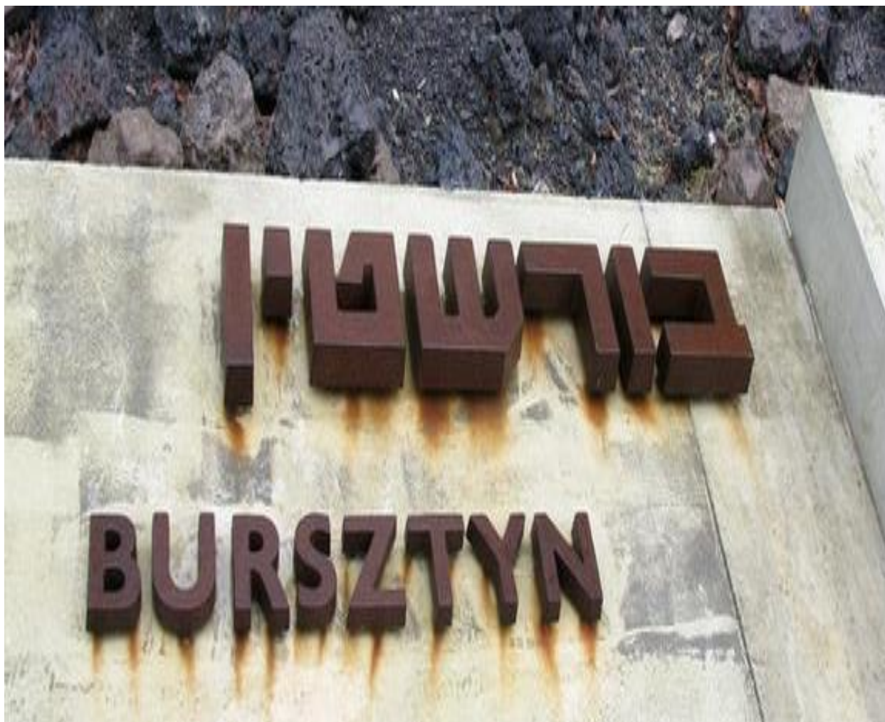
Меморіальний напис у таборі смерті Белжець

У 1950-х роках у Бурштині мешкало кілька єврейських сімей. Будинки 2 синагог, що збереглися, використовувалися під складські приміщення, на території єврейського цвинтаря розбитий міський парк. Сьогодні євреїв тут нема.