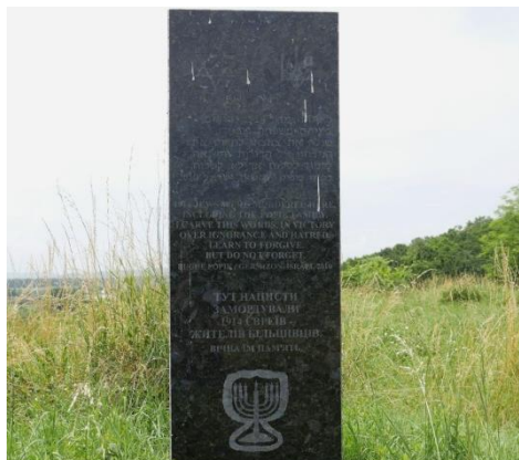
Пам'ятник євреям, які загинули під час німецької окупації.

3 липня 1941 року місто було окуповане німецькими військами. Відразу після входу німців було схоплено і вбито 450 євреїв. Акції, спрямовані на знищення єврейського населення, проводилися під командуванням командира Міллера та його заступника Райхенфатчера.