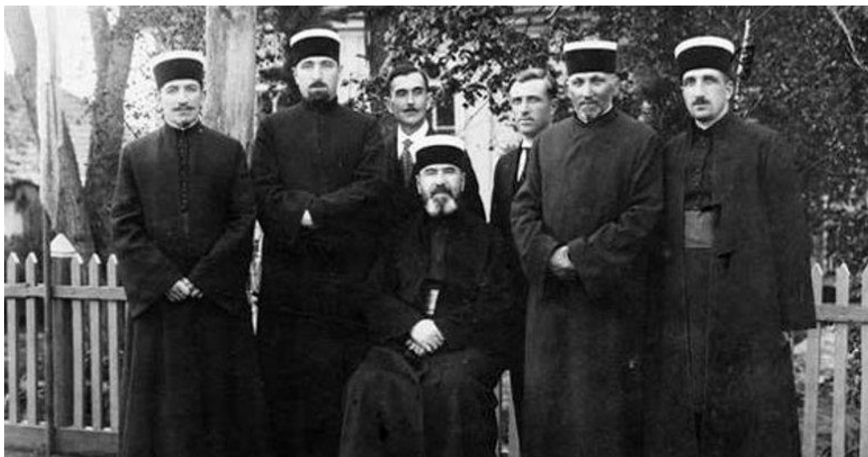
Караїми Галича 91

У 1921 р. у місті проживало 582 євреї (16,9% від усього населення), у 1931 р. — 878 євреїв, у 1939 р. — близько однієї тисячі євреїв і приблизно сто караїмів.