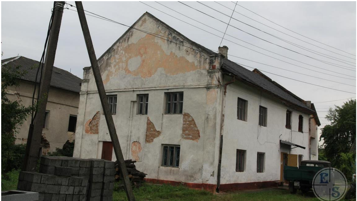
Бурштин, будівля колишньої синагоги.