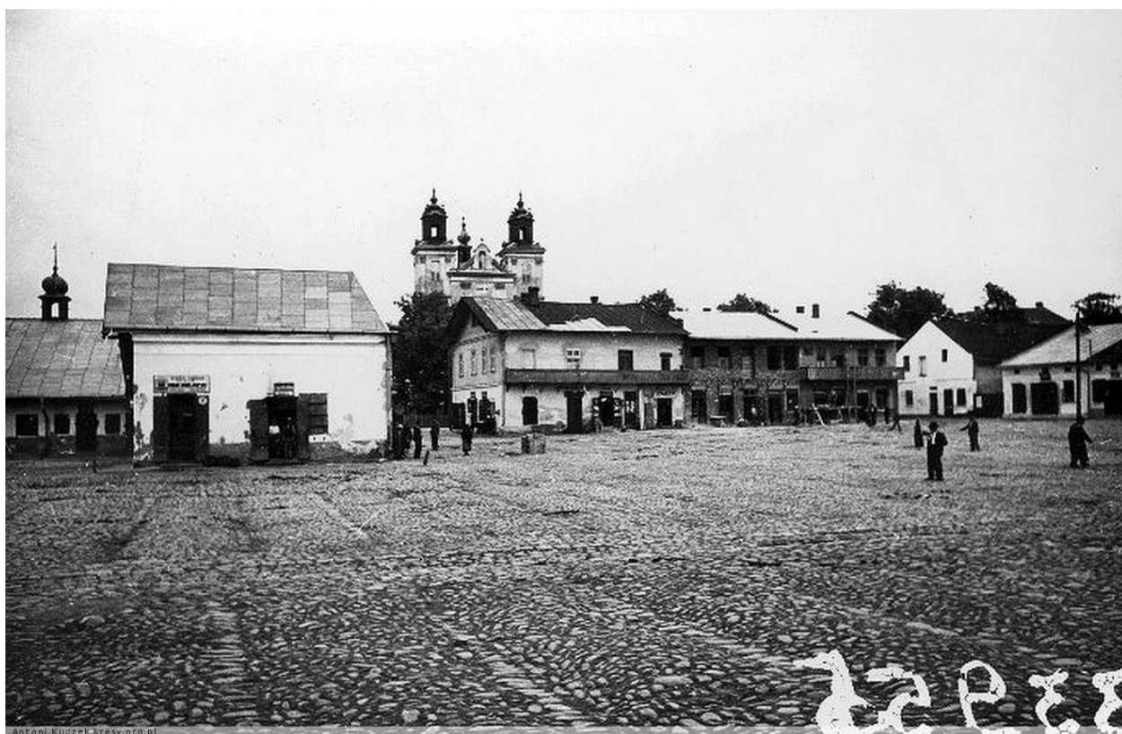
Богородчани, ринкова площа. 1920-1930 рр. 14

Під час Другої світової війни у вересні 1939 року місто було окуповане радянськими військами, а з 27 червня 1941 року — під німецькою окупацією. Багато жителів було вбито, а 80 чоловік відправлено на каторжні роботи до Німеччини.