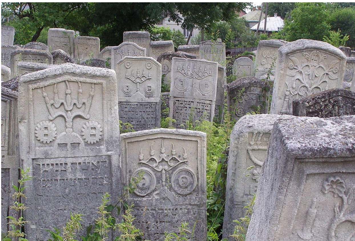
Загальний вигляд єврейського цвинтаря в Бурштині, розташованого між вулицями Герцена та Валовою, 2019р. 62

Під час Німецько-радянської війни (1941—1945) Бурштин перебував під німецькою окупацією від 4 липня 1941 року до 26 серпня 1944 року. 61