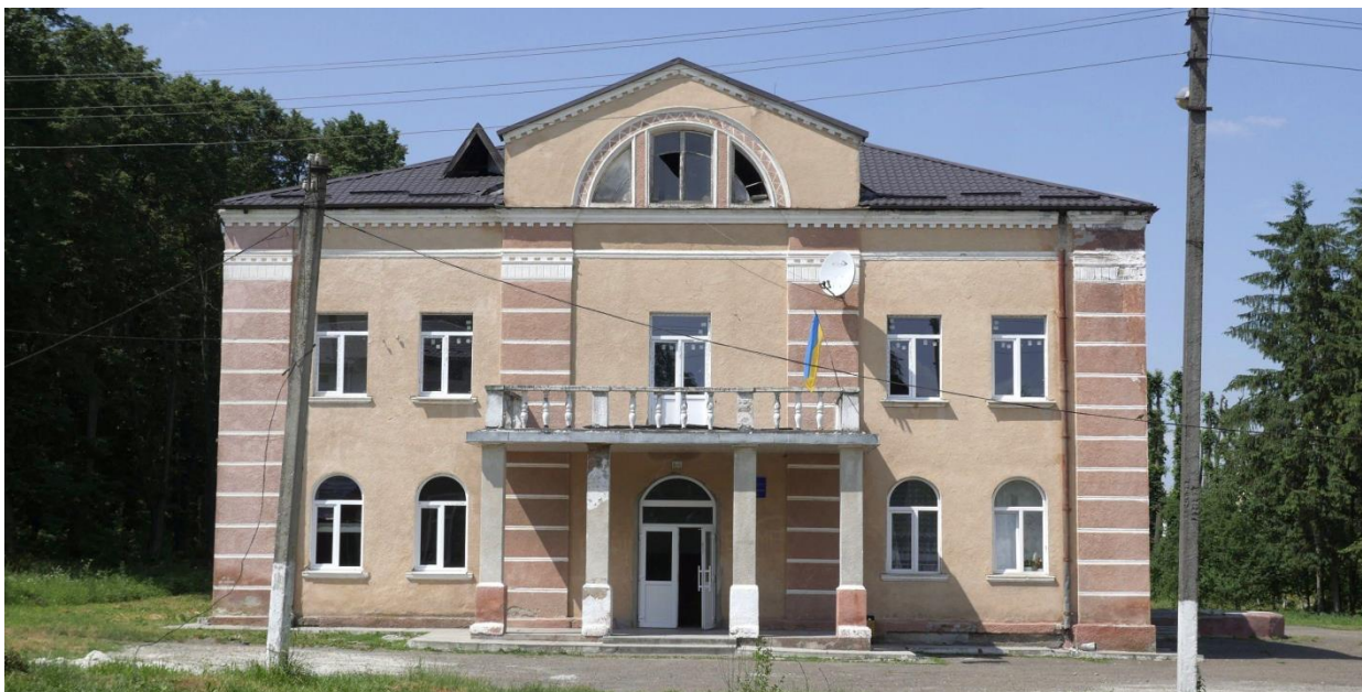
Синагога (вул. Гайова, 6), нині будинок культури. 5

завдяки фінансовій допомозі Американського спільного розподільчого комітету був заснований фонд допомоги євреям.