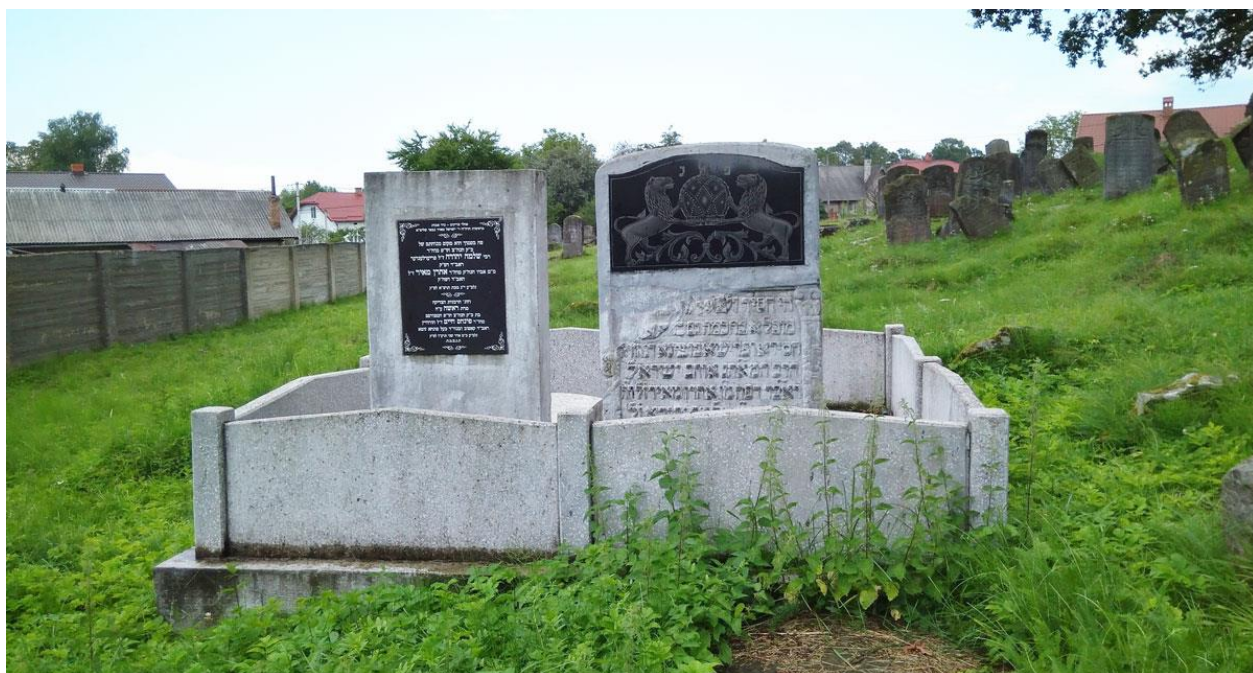
Болехів, єврейський цвинтар. 38

Перекладав на іврит німецькі та польські історичні твори. Окрім того, залишив мемуари, в яких описав соціальне, культурне і політичне життя єврейських громад Галичини XVIII століття. Похований на болехівському кіркуті, його могила збереглася.