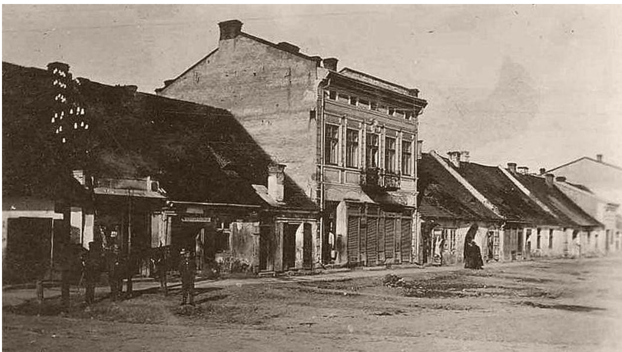
Бурштин, ринкова площа в період перед Першою світовою війною. 58

Перші письмові згадки про поселення, що було попередником сучасного Бурштина — Нове село датуються 1554 (за іншими даними 1436 роком).