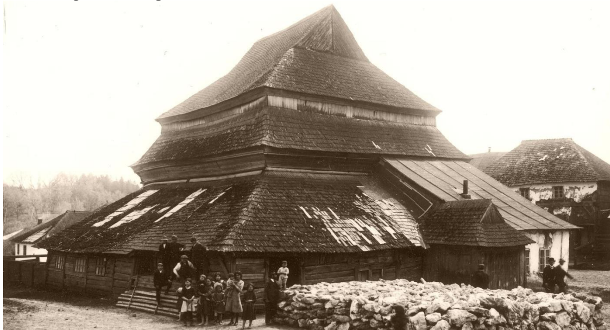
Гвіздець, синагога. 1910-1930 рр. 101