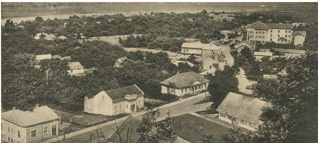
Галич, вул. Судова. 1932 р. 89

У XV ст. центром Галича стає площа Ринок, у центрі якої знаходилась дерев'яна ратуша та торговельні ряди. Шляхта Галицької землі збиралася на сеймики, що відбувалися у приміщенні костелу святої Марії Магдалини. У замку на Галич-Горі засідали гродський і земський суд.