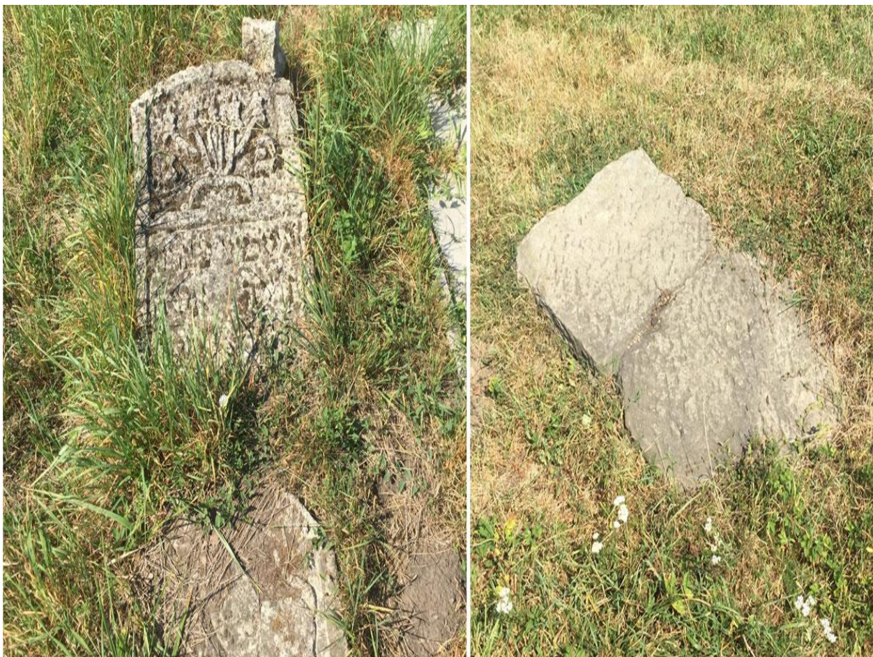
Більшівці, мацеви на єврейському цвинтарі. 7