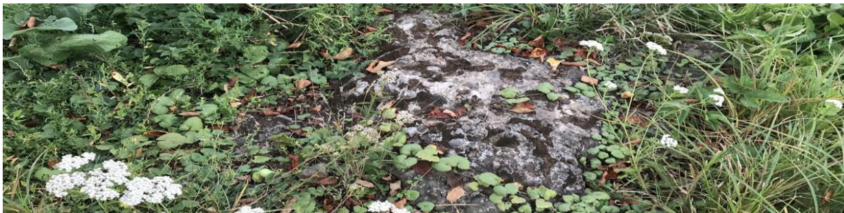
Гвіздець, надгробки на єврейському цвинтарі. 102