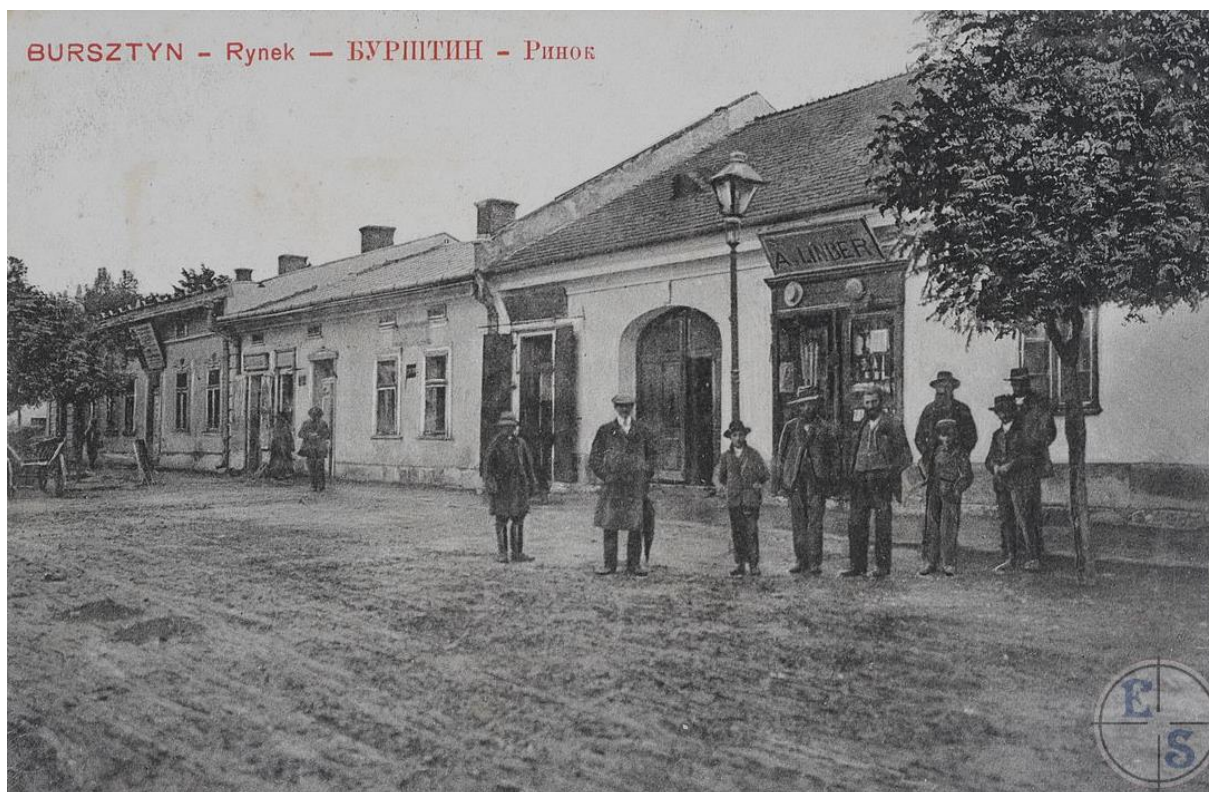
Євреї на майдані Ринок, поч. 20 ст.

У 1865-1914 рр. Бурштин був резиденцією хасидського цадика Нохума Ейхенштейна, правнука Жидачівського Ребе. Хоча Бурштинська династія вважається частиною Жидачівської, сьогодні в Нью-Йорку існують окремі Бурштинські синагоги, і династію очолює Бурштинський Ребе (2015 р – Довід Ейхенштейн).