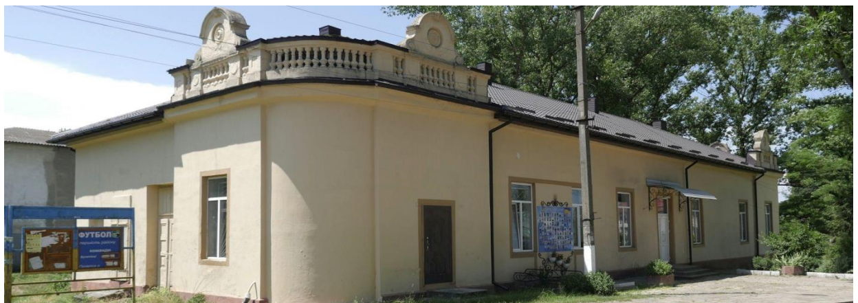
Будівля колишньої синагоги, 2019 рік. 56