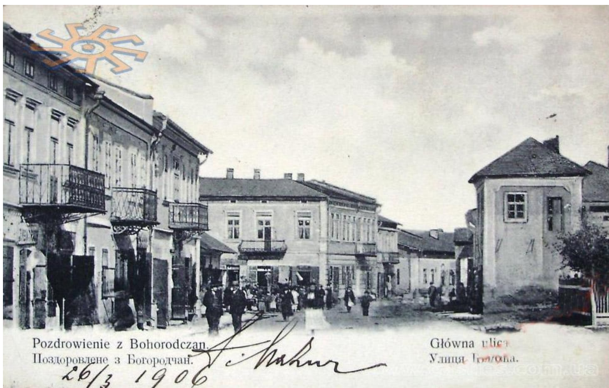
Богородчани, 1906 р. 9

Перша встановлена письмова згадка про Богородчани (ще як село) належить до 3 січня 1441 року. 10 В ній йдеться про те, що власником Богородчан був Ян з Бучача — він же Ян Бучацький, староста тербовлянський.